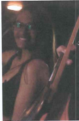
Foto tomada durante el día 2 de ensayo en la gran sala.